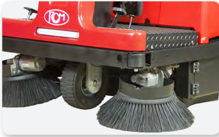
Braccio spazzola laterale sinistro Left side brush arm Brazo lateral izquierda