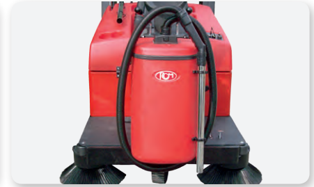
Aspirapolvere Vacuum cleaner Aspiradora