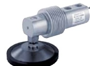
Pied - Foot LFC