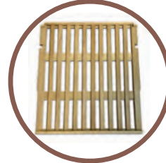
9 + 1 RIPIANI IN LEGNO 9 + 1 WOOD SHELVES