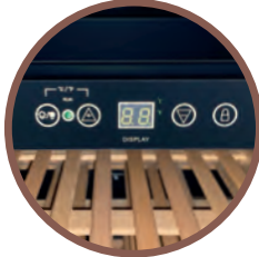
CONTROLORE ELETTRONICO ELECTRONIC CONTROLLER