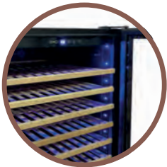
LUCI INTERNE BLU INTERNAL BLUE LED LIGHTS